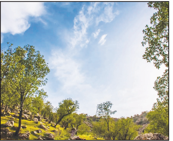
دشت برم، ۳۰ کیلومتری کازرون