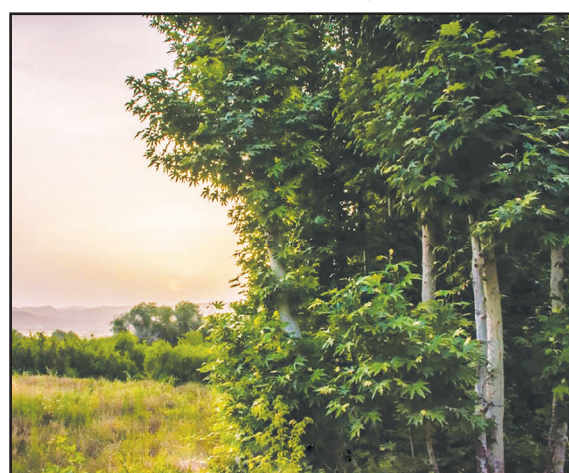
روستای فتح‌آباد، ۱۵ کیلومتری کازرون