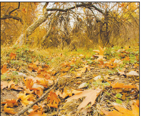
روستای حسین‌آباد حکیم‌باشی، ۱۸ کیلومتری کازرون