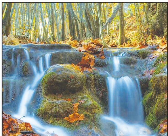
دهکده قلات، ۴۹ کیلومتری شیراز