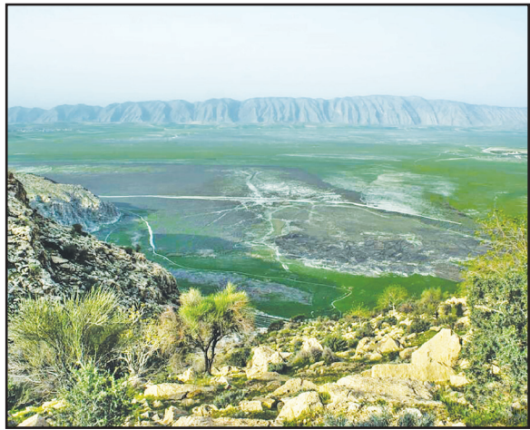
دراچه پریشان، ۱۳ کیلومتری کازرون