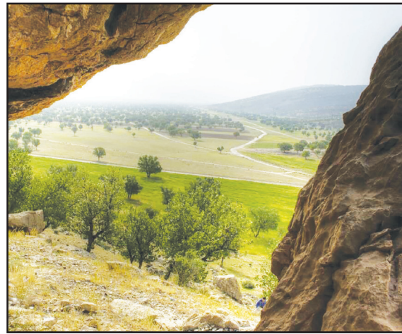
دشت برم، ۳۰ کیلومتری کازرون