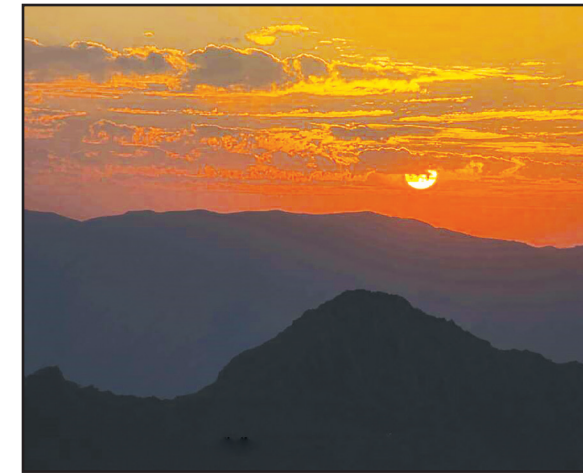
دهکده دوان، ۸ کیلومتری کازرون