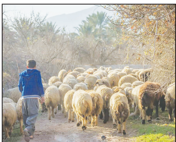
روستای حسین‌آباد حکیم‌باشی، ۱۸ کیلومتری کازرون