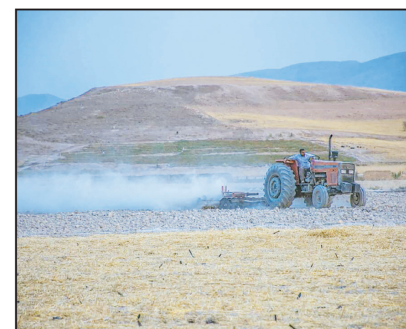
ناصرآباد شرقی، ۳ کیلومتری کازرون