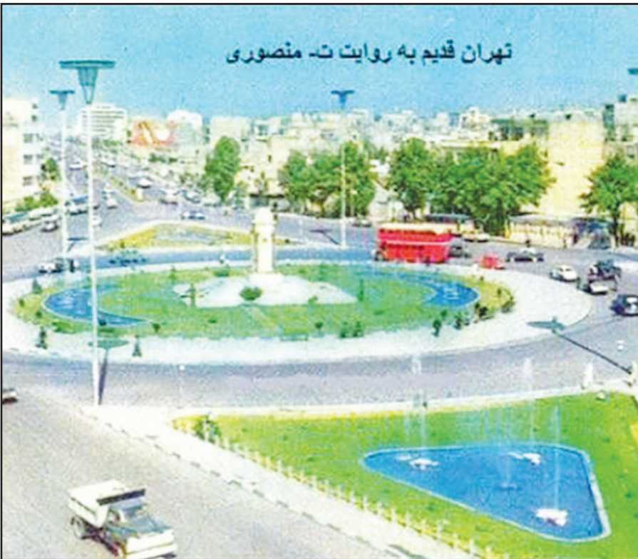
تهران قدیم به روایت ت- منصورى

پس‌از آن که شاپور بختیار به‌عنوان نخست‌وزیر رژیم پهلوی معرفی شد، وی در شانزدهم دی‌ماه ۱۳۵۷، با معرفی اعضای کابینه خود، قدرت را به‌طور رسمی در دست گرفت. کابینه بختیار در حالی روی کارآمد که نهضت خمینی، سراسر کشور را فراگرفته بود و هیچ قدرتی در رژیم، توان رویارویی، مقابله و سرکوب نهضت را در خود نمی‌دید. بختیار به‌عنوان نخست‌وزیر قانونی مشروطه سلطنتی که از جانب محمدرضا شاه پهلوی، انتخاب شده بود! سوگند یادکرد و سعی نمود با اعطای امتیازات گوناگون به مردم، سیل اعتراضات را کاهش دهد. وی پس از معرفی وزیران خود، رئیس برنامه‌های دولت را به اطلاع نمایندگان مجلس و مردم رساند