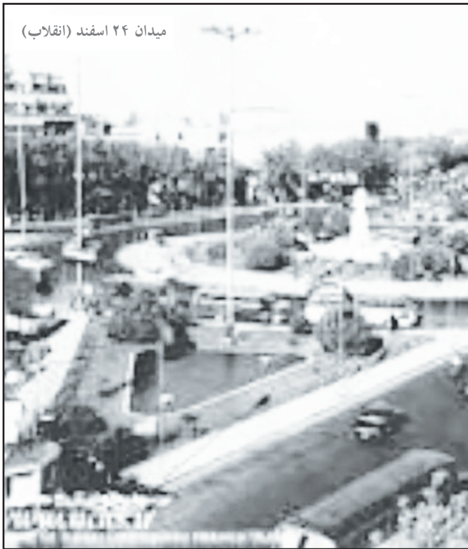
میدان ۲۴ اسفند (انقلاب)