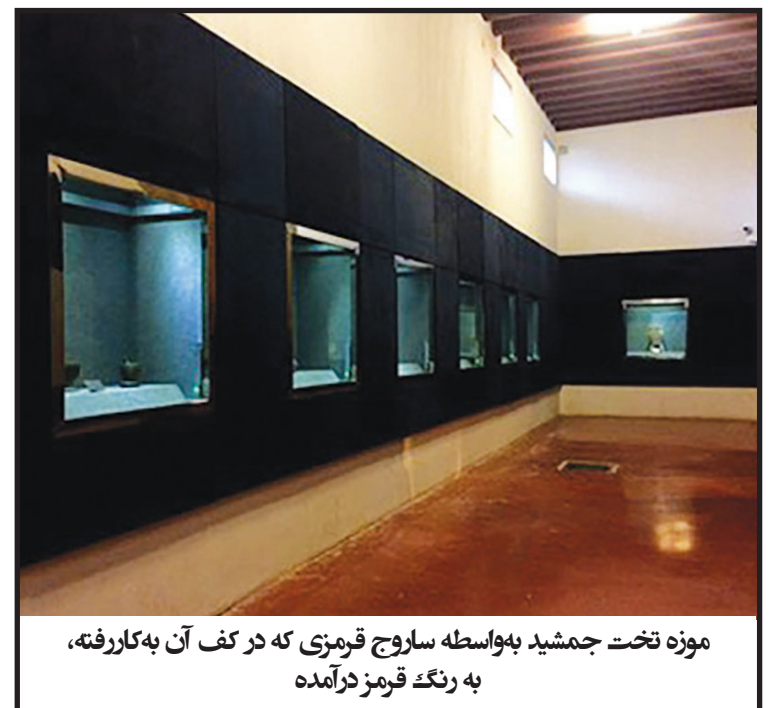
موزه تخت جمشید به‌واسطه ساروج قرمزی که در کف آن به کاررفته، به رنگ قرمز درآمده