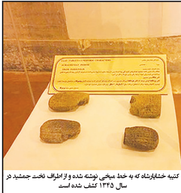
کتیبه خشایارشا که به خط میخی نوشته شده و از اطراف تخت جمشید در سال ۱۳۴۵ کشف شده است

کتیبه خشایارشا که به خط میخی نوشته شده و از اطراف تخت جمشید در سال ۱۳۴۵ کشف شده است نیز نه تنها به نمایش درآمده بلکه به زبان فارسی نیز ترجمه شده است.