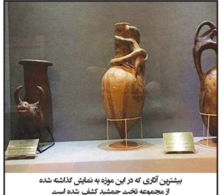
بیشترین آثاری که در این موزه به نمایش گذاشته شده از مجموعه تخت جمشید کشف شده است

همچنین تویی چرخ ارابه و دهانه اسب مفرغی و ریتون‌های سفالین را در این موزه به نمایش گذاشته شده است.