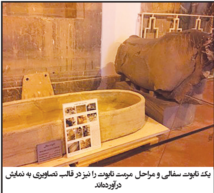
یک تابوت سفالی و مراحل مرمت تابوت را نیز در قالب تصاویری به نمایش درآورده‌اند

یک تابوت سفالی و مراحل مرمت تابوت را نیز در قالب تصاویری به نمایش درآورده‌اند و قسمتی دیگر مربوط به نمایش پنجه پای مجسمه انسان از سنگ مرمر سفید است که متعلق به دوره فرا هخامنشی بوده و در ناحیه شمال غربی خارج از صه تخت جمشید (ناحیه معروف به فراتادارا) کشف شده است.