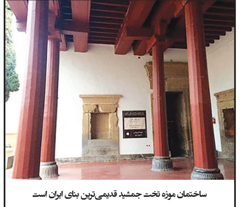
ساختمان موزه تخت جمشید قدیمی‌ترین بنای ایران است

ساختمان موزه تخت جمشید قدیمی‌ترین بنای ایران است که بازسازی شده و به موزه اختصاص یافته است. این بنا یکی از مجموعه کاخ‌های تخت جمشید است که حدود ۲۵۰۰ سال پیش توسط سلسله هخامنشی بنا شد.