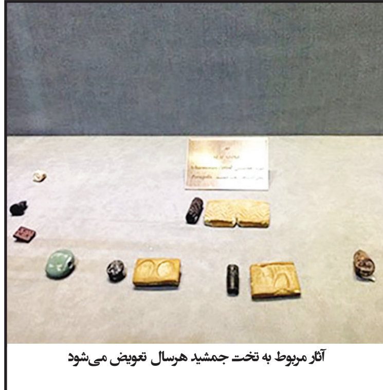
آثار مربوط به تخت جمشید هر سال تعویض می‌شود

بیش از ۵ هزار شیء مطالعاتی در مخزن و ۴ هزار شیء موزه‌ای و شاخص در این موزه وجود دارد که نزدیک به ۱۷۰ اثر به نمایش گذاشته شده است. ما برخی از اوقات این آثار را از مخزن بیرون آورده و به نمایش می‌گذاریم. همه آثار موزه شاخص و مهم هستند؛ اما در این میان کتیبه خشایارشا و کتیبه‌های میخی بیشتر مورد توجه قرار می‌گیرند.