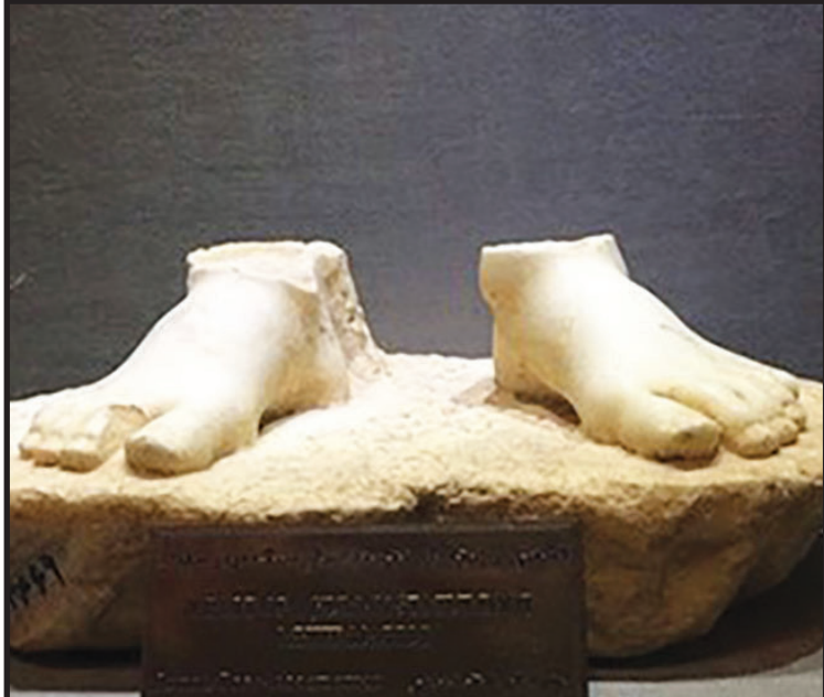
الواحی که در موزه گذاشته شده است، هنگام پاک‌سازی تخت جمشید به‌دست آمده‌اند

الواحی که در موزه گذاشته شده است، هنگام پاک‌سازی تخت جمشید به‌دست آمده‌اند و پس از ترجمه معلوم شده سند پرداخت دستمزد به کارگران بوده که به‌صورت نقدی داده می‌شده است.