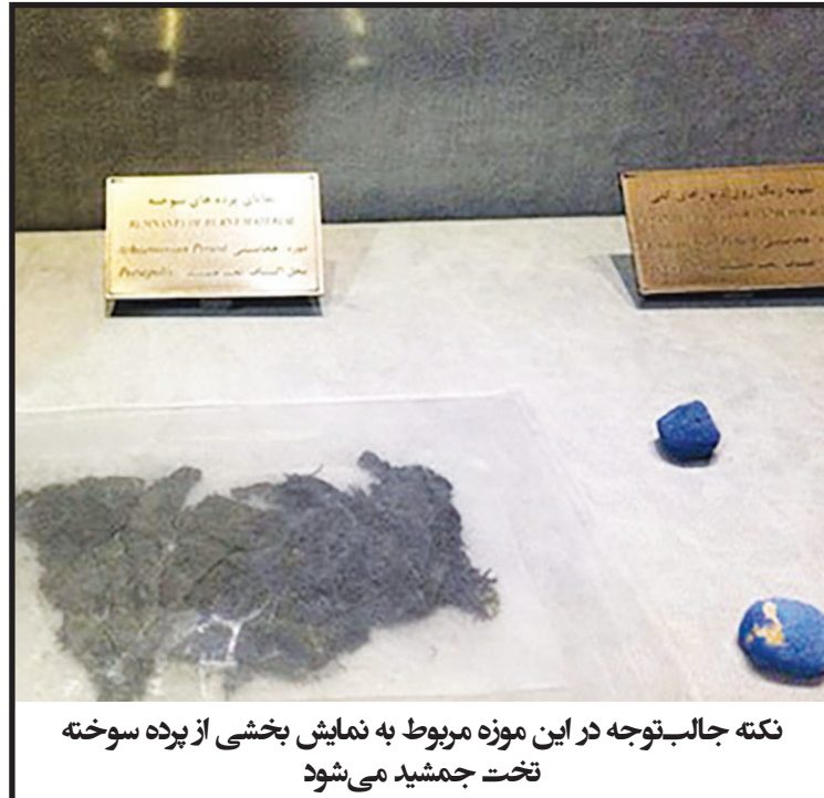
نکته جالب توجه در این موزه مربوط به نمایش بخشی از پرده سوخته تخت جمشید می‌شود

نکته جالب توجه در این موزه مربوط به نمایش بخشی از پرده سوخته تخت جمشید می‌شود که بعد از دو هزار و ۵۰۰ سال هنوز باقی‌مانده و از جمله کشفیات تخت جمشید است.