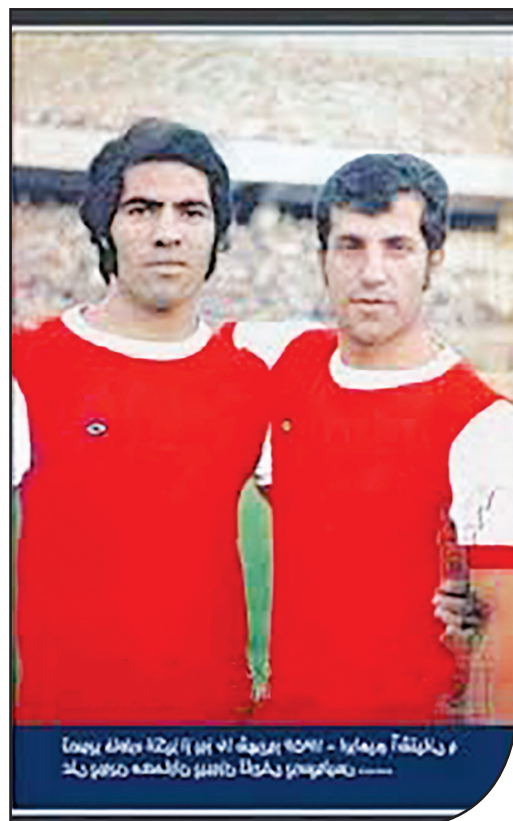
ابراهیم آشتیانی و علی پروین ستاره‌های ایرانی در جام ملت‌های ۱۹۷۲ و ۱۹۷۶

ایران با پیروزی ۸-۰ مقابل یمن جنوبی در جام ۱۹۷۶ رکورد بهترین پیروزی در تاریخ این مسابقات را نیز به خود اختصاص داده است. ایران سه دوره پیاپی قهرمانی را کسب کرده است ۱۹۶۸-۱۹۷۲ و ۱۹۷۶.