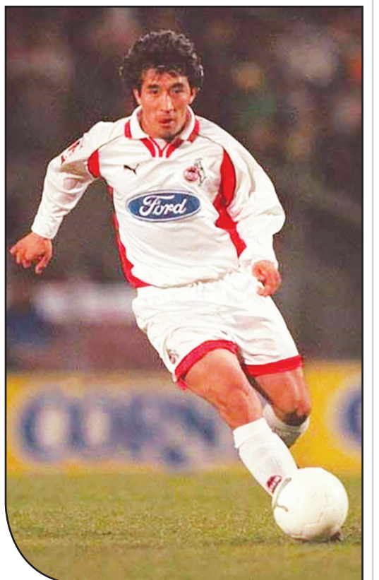
خداداد عزیزی ستاره جام ملت‌های ۱۹۹۶

تکالی درباره ایران در تاریخ جام ملت‌های آسیا همایون بهزادی زنده اولین گل ایران در مرحله نهایی جام ملت‌های آسیاست. حسین کلانی هم اولین هت تریک ایران در این رقابت‌ها انجام داد. ایران در ۱۳ دوره حضور خود ۱۱ بار به یک‌چهارم نهایی رسیده، ۸ بار به جمع ۴ تیم رسیده و ۳ بار هم به فینال رسیده است.