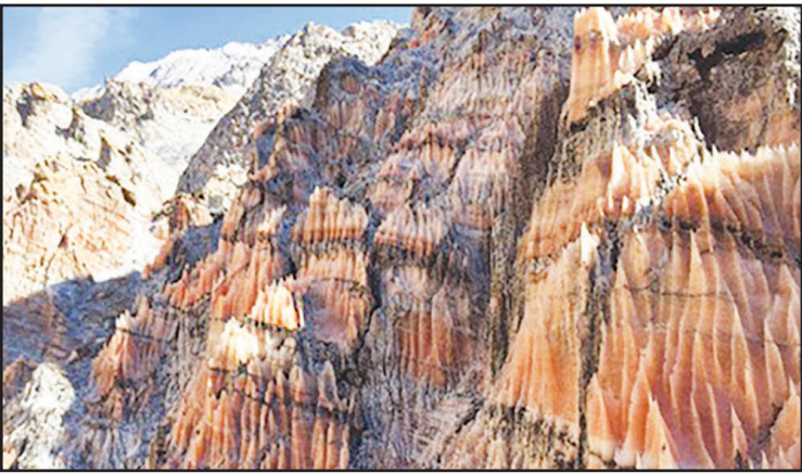
گنبد های نمکی جاشک

جاده خورموج - کنگان را ادامه دهید تا ابتدا به شهر کوچک «کاکي» برسید. تقریباً ۱۶ کیلومتر بعد از کاکي، یک جاده فرعی خاکی در سمت چپتان است که برای ورود به آن باید از دوربرگردان بعدی، وارد باند مقابل شوید. در انتهای این جاده خاکی و شش کیلومتری (موسوم به جاده معدن نمک جاشک) می‌توانید خودروتان را پارک کنید و با کفش مناسب، شروع به دامنه نوردی در میان گنبد های نمکی کنید. این احجام سنگی نمکی، از همان‌جا شروع شده است و هرچه جلوتر بروید بزرگ‌تر و خوش‌رنگ‌تر می‌شوند، شوره‌ها های کوچکی را هم می‌توانید در مسیرتان ببینید.