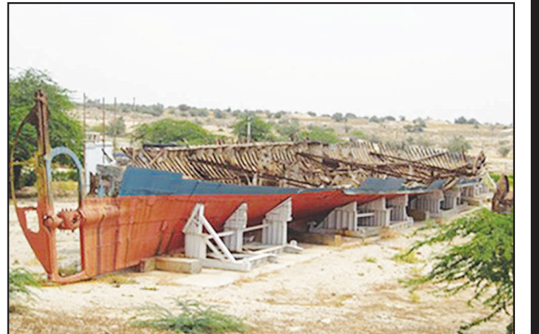
نخستین ناو جنگی ایران

در استان گردی‌تان حتماً سری هم به موزه‌های بوشهر بزنید. مثل موزه «دریا و دریانوردی خلیج‌فارس» که در عمارت قاجاری و زیبای کلاه فرهنگی در ساختمان کنسولگری وقت انگلستان بندر بوشهر قرار دارد. این موزه که زیر نظر نیروی دریایی ارتش اداره می‌شود، ابزار هدایت کشتی، ادوات سطحی و غیر سطحی جنگی دریایی و البته بقایای کشتی ۱۱۰ ساله «پرسپولیس» را که نخستین ناو جنگی ایران بوده، برای بازدید عموم در محوطه بزرگ خود جای داده است.