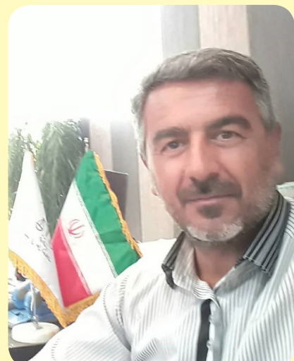
قبل از هر چیز باید توجه داشته باشیم که هدف و منظور اصلی از شوراهای حل اختلاف ایجاد صلح

و سازش و همچنین ایجاد آرامش و دوستی و رفع اختلاف‌ها بین افراد در جامعه و خانواده‌هاست. یکی دیگر از مشکلاتی که متأسفانه امروزه باعث اختلاف بین افراد در جامعه و به‌خصوص خانواده‌ها در زندگی مشترک گردیده اهمیت ندادن به نیازهای همسر و به‌خصوص نیاز جنسی اوست که همان تمکین خاص بوده و همچنین این‌گونه رفتارها می‌تواند باعث از بین بردن محبت و مهریابی بین زن و شوهر و ایجاد اختلاف و کینه در دل آنان شود؛ و البته می‌بایست زوجین این نیاز را به‌موقع و صحیح و با درک متقابل برطرف کنند. گاهی اوقات عدم تمکین و نشوز از ناحیه زن و یا شوهر می‌تواند آغاز یک مشاجره و عصبانیت و درگیری در خانواده شود که پایان آن جدایی و طلاق عاطفی است که بسیار خطرناک بوده و حتی ممکن است در زمان کوتاهی به طلاق مبارات تبدیل شود و این در حالی است که زن و شوهر به‌شدت از یکدیگر تنفر پیدا می‌کنند که در