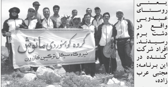
اعضای گروه کوهنوردی مانوش (نیروگاه سیکل ترکیبی کازرون)، کوه پیمایی خود را از حوالی بل ترکیبی واقع در جاده قدیم شیراز - کازرون آغاز نمودند و با گذشتن از جنگل زیبای بلوط و بادام کوهی، دره‌ها، تنگه‌ها و کوه شمالی دشت برم، در غروب همان روز به مقصد نهایی خود