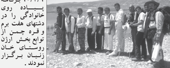
اعضای گروه کوهنوردی مانوش (نیروگاه سیکل ترکیبی کازرون)، کوه پیمایی خود را از حوالی بل ترکیبی واقع در جاده قدیم شیراز - کازرون آغاز نمودند و با گذشتن از جنگل زیبای بلوط و بادام کوهی، دره‌ها، تنگه‌ها و کوه شمالی دشت برم، در غروب همان روز به مقصد نهایی خود

به گزارش روابط عمومی گروه‌های کوهنوردی آزادگان و مهرگان (بانوان) طبق برنامه از پیش تعیین شده، گروه‌های مذکور روز جمعه (۹۰/۲/۹) برنامه پیاده روی خانوادگی را در دشت‌های هفت برم و قره چمن از توابع بخش ارژن روستای خان