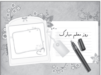
روز معلم مبارک

مدرسه نایبند، این آموزگار محترم؟ ۱- نمی‌دانسته هدف از تحصیل چیست؟ می‌پنداشته هدف دسترسی به بازار کار است. آن هم کار دولتی. لذا تحصیل علم را صرفاً وسیله‌ای برای رسیدن به این منظور می‌دانسته نه افزایش فهم و شعور اجتماعی.