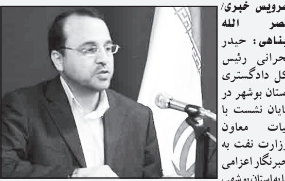
سرویس خبری / نصر الله پناهی؛ حیدر بحرانی رئیس کل دادگستری استان بوشهر در پایان نشست با بیات معاون وزارت نفت به خبرنگار اعزامی ما به استان بوشهر،

برقراری امنیت اقتصادی را یکی از مهمترین وظایف قوه قضاییه عنوان کرد و گفت: در سالی که جهاد اقتصادی نام گرفته است تلاش می کنیم زمینه های لازم برای رشد اقتصادی استان در سایه آرامش و امنیت اقتصادی فراهم شود. حیدر بحرانی رئیس کل دادگستری استان بوشهر افزود: برای توفیق در اجرای طرح های ملی همه باید کمر همت ببندند و دستگاه قضاییه به این منظور از ظرفیت های موجود برای حل مشکلات احتمالی پیش روی طرح های ملی استفاده می کند و از توان قضات برجسته برای تسریع در این امور بهره خواهد برد. حیدر بحرانی افزود: بدون شک هدف همه ما توسعه همه جانبه کشور است و تعامل وزارت نفت با قوه قضاییه می تواند برای اجرای طرح های ملی در استان بوشهر بسیار موثر و ارزشمند باشد. رئیس کل دادگستری استان بوشهر افزود: استان بوشهر در امر ساخت مسجد، مدرسه و ساخت مسکن برای نیازمندان و آزادسازی زندانیان جرایم غیر عمد جزء چند استان برتر و اول کشور است و همه ساله در این زمینه از سوی قوه قضاییه و وزارت دادگستری و ستاد دیه کشور مورد تجلیل و تقدیر قرار می گیرد که انتظار داریم امسال با تعامل و همدلی با وزارت نفت از سال های گذشته فعالیت و هدفمندتر حرکت کنیم.