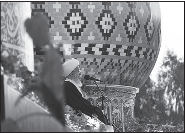
آیت الله مکارم شیرازی گفت: برای حفظ ثمره خون شهدا نگذاریم بیگانگان در مقام های حساس کشور نفوذ کنند.

این مرجع تقلید در ادامه سخنان از بروز برخی رفتارهای سیاسی در کشور ابراز نگرانی کرد و افزود: کسانی پول های هنگفتی خرج می کنند که مجلس را در دست بگیرند اما مردم سعی کنند نقشه کش ها و نقشه را بشناسند و آنها را مانند همیشه مایوس کنند.