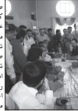
توسعه کمربندی شهر قائمیه را تسریع در صورت انجام مطالعاتش اجرا خواهد شد در غیر این صورت یابه مطالعاتش به محض تکمیل آن مشخص شد بحث مشارکت آن اجرا خواهد شد. صادق از انجام عملیات مطالعات آزاد راه شیراز - بوشهر خبر داد و خاطر نشان کرد اهالی کازرون به مسیر موجود این آزاد راه به دلیل عبور نکردن آن از این شهرستان اعتراض دارند که قول بررسی این موضوع را دادیم و در صورتی که وضعیت تو یوگرافی زمین و توجیه فنی و اقتصادی اجازه دهد این کار را انجام خواهیم داد. وی گفت: عملیات آغاز کنار گذر شمال شرقی شهر شیراز به طول ۱۵ و نیم کیلومتر به صورت بزرگراه چهار خطه و با اعتبار ۱۷۲ میلیارد ریال و تقاطع غیر همسطح دروازه قرآن شیراز به طول ۵ هزار متر و اعتبار ۳۳ میلیارد ریال آغاز شده است.

سرویس خبری / داود کشاورز: احمد صادقی معاون وزیر راه و شهرسازی در حاشیه بازدید از پروژه تونل محرم جاده شیراز و کازرون در جمع خبرنگاران گفت: به دنبال مشکلات مردم هستیم و برای تسریع در عملیات اجرایی تونل محرم به عنوان یکی از نیاز ها و خواسته مردم کازرون، دستورات لازم را صادر کردیم و با توجه به آماده بودن تونل برای انفجار کمک خواهیم کرده تا پشتیبانی هر چه سریع تر عمل انفجار و سوراخ تونل را آغاز کند. وی گفت: روشنایی تونل های محور کازرون به ارژن از روشنایی این تونل ها در هفته دولت خبر داد و افزود: در این خصوص دستورات لازم صادر شده است و در اسرع وقت روشن می شوند. معاون وزیر راه و شهرسازی خواستار انجام روشنایی تقاطع غیر همسطح در محور قائمیه شد و اضافه کرد: در این بازدید دو اولویت انجام کمربندی خان