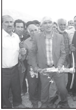
تونل نیز آغاز شد.

سرویس خبری / داود کشاورز: با حضور معاون وزیر راه و شهرسازی عملیات اجرایی تونل محرم آغاز شد. احمد صادقی معاون وزیر راه و شهرسازی به همراه حسن فدایی مدیر کل راه و ترابری استان فارس و مسئولان محلی شهرستان کازرون از پروژه های راه سازی در محور شیراز کازرون- کازرون-بو شهر تونل های محرم، تنگ ترکان، روشنایی تونل های جاده جدید کازرون به ارژن بازدید کردند. در این بازدید معاون وزیر راه و شهرسازی دستور فعال شدن عملیات اجرایی تونل محرم را داده که با این دستور عملیات اجرایی این