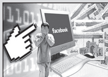
کلاهداری کرده بود، معلوم شد او با ارتباط اینترنتی از ۲۴۳ دختر جوان نیز خواستگاری کرده است.

با تحقیق از فردی که از خانواده دختر مورد علاقه اش شش میلیون تومان