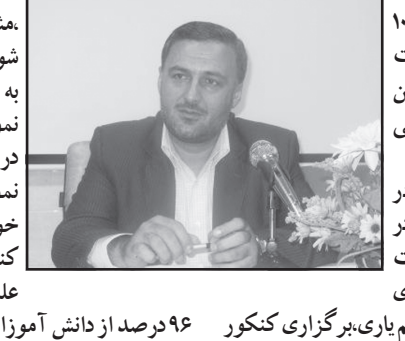
مدیر صدور پروانه‌ها و مجوزهای سازمان جهاد کشاورزی فارس