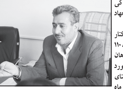
مدیر صدور پروانه‌ها و مجوزهای سازمان جهاد کشاورزی فارس

کارشناسی و بر مبنای بیشترین مصرف از سوی وزارت نیرو پیشنهاد شده است. وی با اشاره به اینکه قیمت برق برای دهک‌های پایین تغییر نمی‌نماید و ارائه بسته‌های تسویقی برای مشترکان کم مصرف گفت: نرخ‌های جدید در دست بررسی است که با تحلیل حساسیت مصرف کنندگان بر اساس عملکرد یک سال اخیر و مقایسه سایر سوخت‌ها در سبد انرژی به محض رسیدن به نتیجه مشخص، اعلام خواهد شد.