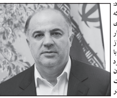
مدیر عامل توانیر: حجم بدهی وزارت نیرو ۹ هزار میلیارد تومان است

محمدی گفت: در بخش موضوعات در مدیریت صدور پروانه‌ها، بحث