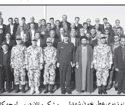
مراسم تکریم از بازنشستگان و پیشکسوتان ارتش در مرکز آموزش پیاده