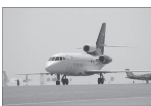
نمایندگان مجلس شورای اسلامی برای اجرای برنامه های بهسازی و تجهیز فرودگاه های کشور و ارائه خدمات بهتر به مسافران با افزایش قیمت بلیت هواپیما در سفرهای داخلی و خارجی از ابتدای فروردین سال ۱۳۹۱ موافقت کردند.

نمایندگان مجلس شورای اسلامی برای اجرای برنامه های بهسازی و تجهیز فرودگاه های کشور و ارائه خدمات بهتر به مسافران با افزایش قیمت بلیت هواپیما در سفرهای داخلی و خارجی از ابتدای فروردین سال ۱۳۹۱ موافقت کردند. به گزارش خبرنگار پارلمانی ایرنا، نمایندگان در جلسه علنی روز سه شنبه مجلس به بررسی کلیات و جزئیات طرح اصلاح ماده ۴۸ قانون مالیات بر ارزش افزوده مصوب ۱۳۸۷ پرداختند و این طرح را تصویب نهایی کردند. با تصویب نمایندگان مجلس، ماده ۸۷ قانون وصول برخی از درآمدهای دولت اصلاح شد. نمایندگان مجلس به شرکت مادر تخصصی