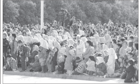
برنامه رأس ساعت ۹ صبح با کف و هورای جبهه ها شروع شد و صدا و تصویر کودکان شیرازی از شبکه دو پخش می شد.

همزمان با جشن های دهه مبارک فجر فضای امید و نشاط در بین کودکان و خانواده هایشان ایجاد شد و این بارشادی کودکان شیرازی در برنامه زنده خاله شادونه در باغ عقیق آباد دیدنی بود. هر کس از زنده خیابان های منتهی به باغ عقیق آباد در تردد بود، کودکانی را مشاهده می کرد که به همراه والدین خود به سمت محل اجرای برنامه در حرکتند و برای رسیدن به باغ لحظه شماری می کردند.