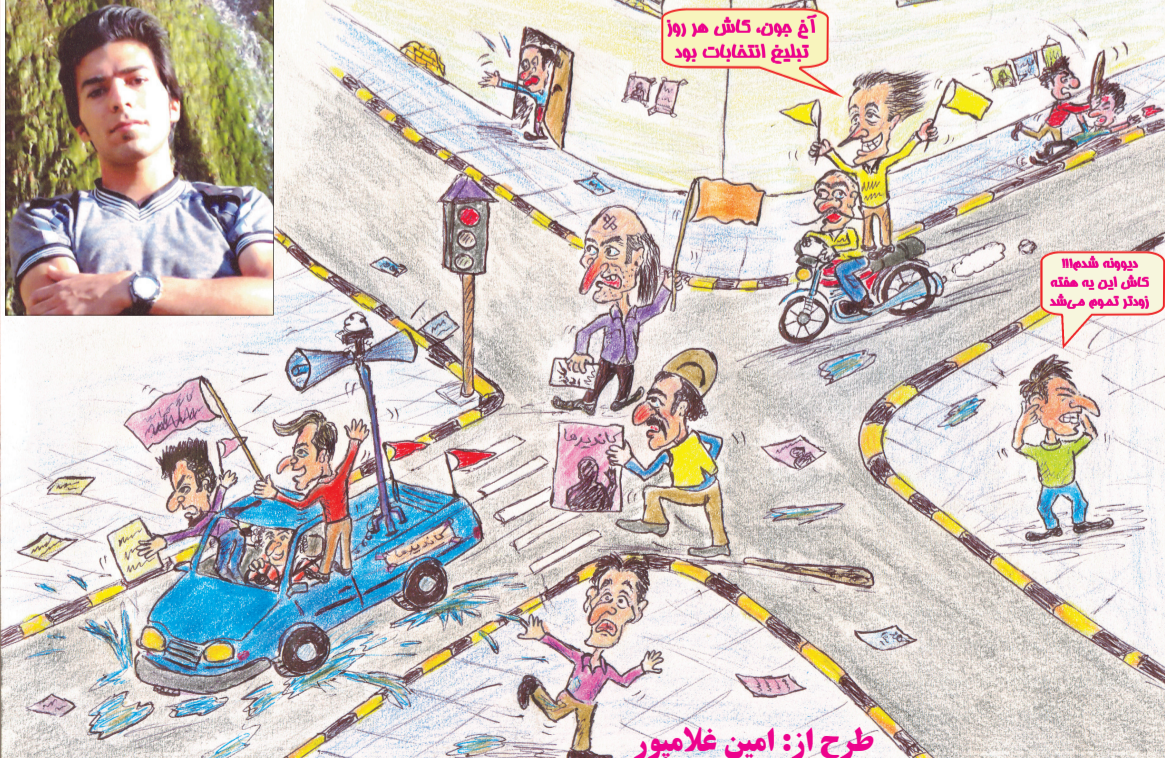
طرح از: امین غلامپور