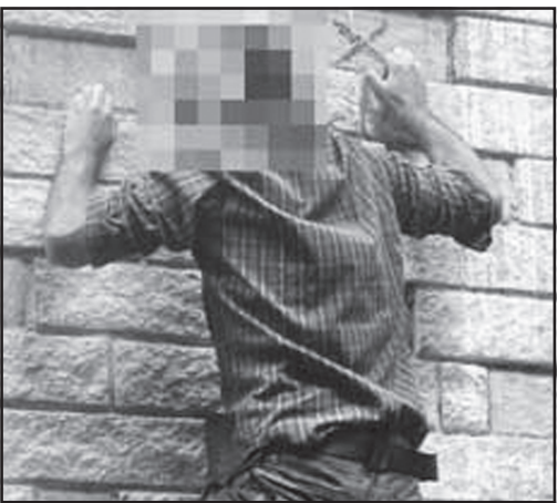
متهم سابقه دار بود

دزد سابقه دار درباره محبوس شدن سه روزه خود در خانه مالباخته گفت: پس از سرقت طلاها و اموال قیمتی خواستم از کانال منتهی به کولر خارج شوم که در نیمه راه گرفتار شدم. وی اضافه کرد: بناچار بازگشتم و چون راهی برای فرار نداشتم، همان جا خوابیدم. روز بعد خواستم غذایی تهیه کنم، اما شبکه اصلی گاز قطع بود و در یخچال هم غذایی نبود. از فرط گرسنگی آشپزخانه را جستجو و مقداری سیب زمینی و پیاز پیدا کردم و سه شبانه روز که آنجا محبوس بودم، غذایم فقط آب و سیب زمینی خام بود. متهم گفت: با این وضعیت دیگر طاقت ماندن در آن خانه را نداشتم. به همین دلیل چند بار خواستم با داد و فریاد از همسایه ها کمک بخواهم، اما از ترس کتک خوردن و دستگیری توسط آنها از این تصمیم صرف نظر کردم. وی یاد آورد: آنقدر حالم بد شده بود که برای از این وضعیت و نجات جان خود، با مرکز فوریت های پلیسی ۱۱۰ تماس گرفتم و با التماس از ماموران کمک خواستم. بنابراین گزارش، متهم با اعتراف به چند فقره سرقت سریالی اموال مردم در شمال تهران، با قرار قانونی روانه زندان شده است، اما تحقیقات تکمیلی از او ادامه دارد.