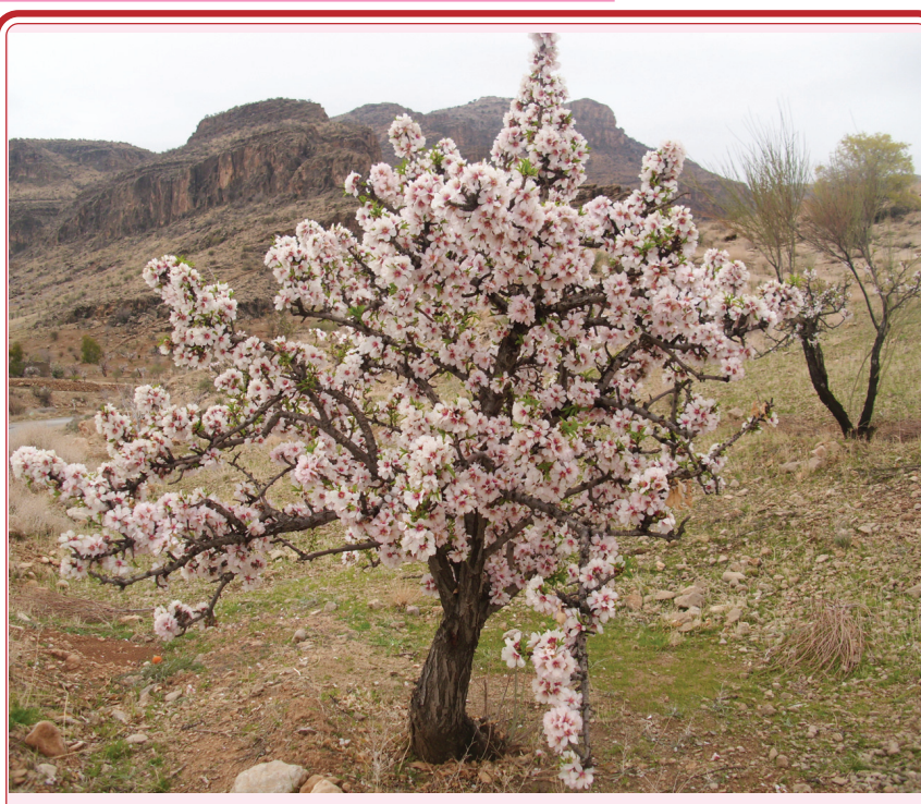
از نگاه دوربین شکوفه های بادام: تفرجگاه کوه های پلنگان (نی ریز)

تیپ های شخصیتی جذاب و خلاقانه می تواند بهترین قدم در لحاظ قدمت در ساخت بلکه از لحاظ ارتقا و رشد کیفی برنامه تولید انیمیشن در کشور از جایگاه والایی برخوردار است و امیدواریم از این پس نیز مانند همیشه بر قله افتخار بدرخشند. کشفی مدیر کل مرکز فارس در این مراسم گفت: امسال از ابتدای سال تلاش کردیم که پیش برنامه های مرکز فارس بر اساس تولیدات داخلی باشد و در سال جاری سریال نقل و نبات، تله فیلم سین هشتم، روزی بود روزی نبود بارها و بارها از شبکه های سراسری و شبکه های استانی پخش شد و این روند را ادامه خواهیم داد تا در عرصه رسانه ای بیشترین حضور را در شبکه ها داشته باشیم و در قالب و ساختارهای مختلف تولیدات فاخر تهیه کنیم و شرایطی را فراهم سازیم که مردم فرهیخته فارس، آداب و رسوم و زیبایی های سرزمین و مفاخر خود را از این رسانه ببینند و بشنوند و لذت ببرند از جمله در ساختار انیمیشن برنامه های متعددی تولید شد که برنامه انیمیشن بادبادک یکی از این مجموعه است.