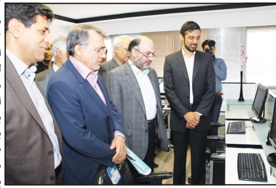
پهلو کیفیت انیمیشن های تولیدی گام های بلندی برداریم. وی ادامه داد: ما مراحل اولیه کار یعنی قصه گویی و داستان نویسی تا مراحل پایانی سمی کرده ایم با استفاده از تکنیک های رنگ و صدا و ایجاد فضایی شاد و آهنگین جذابیت بیشتری به اثر بخشیده و با استفاده از این جذابیت در کنار القای حس شادی و خلاقیت به کودکان، بار آموزشی لازم را به آنها منتقل نموده ایم. دکتر طهماسبی مدیر کل امور استانها در مراسم افتتاح این انیمیشن بیان کرد: در سایر کشورهای جهان انیمیشن را با معادل کارتون نمی دانند و ویژه گروه سنی خاصی نیست اما متأسفانه در کشور ما، انیمیشن معنایی مترادف با کارتون و برنامه خردسال پیدا کرده است و آنرا فقط مختص به کودکان می دانند. وی تأکید کرد: از آنجایی که در کشور ما گروه سنی