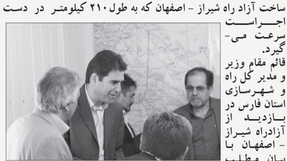
ساخت آزاد راه شیراز - اصفهان که به طول ۲۱۰ کیلومتر در دست اجراست -

سرعت می‌گیرد. قائم مقام وزیر و مدیر کل راه و شهرسازی استان فارس در بازدید از آزادراه شیراز - اصفهان با بیان مطلب فوق گفت: بزرگترین افتخار من بهره برداری از پروژه آزاد راه شیراز اصفهان خواهد بود.