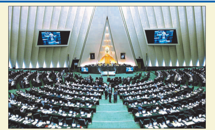
سختگوی هیات ریسه اعلام کرد:

معاون درمان وزارت بهداشت، درمان و آموزش پزشکی اعلام کرد: هیات دولت افزایش ۲۰ درصدی تعرفه درمانی برای سال جدید را تصویب کرد. «سید حسن امامی رضوی» در گفت و گو با ایرنا افزود: این تعرفه از سوی هیات وزیران مورد موافقت قرار گرفت که به زودی به سازمان ها و دستگاه های متولی ابلاغ خواهد شد. وی گفت: تعرفه مصوب در اولین فرصت ابلاغ خواهد شد. معاون درمان وزارت بهداشت، درمان و آموزش پزشکی در گزارشی در همین راستا اعلام کرد، در جلسات متعدد بین وزارتخانه های بهداشت و رفاه و نیز سازمان های بیمه گر، وزارت بهداشت تعرفه ۲۵ درصدی و بیمه ها تعرفه ۱۲ درصدی را پیشنهاد کرده بودند که در نهایت تعرفه ۲۰ درصدی به تصویب هیات وزیران رسید. براساس این گزارش، سال گذشته تعرفه های درمانی ۹ درصد تصویب شد که بر اساس مصوبه امسال این تعرفه ها ۱۱ درصد افزایش خواهد یافت. این مصوبه با تاخیری حدود ۳ ماه اعلام شد که علت این تاخیر نیز عدم تفاهم طرفین بر عدد درصد افزایش تعرفه ها بوده است. بحث به روز شدن تعرفه های درمانی بر اساس تورم اقتصادی کشور و سایر مسائل نظارتی و قانونی درمانی، یکی از بحث های همیشگی و مطرح نظام سلامت بوده است. کمیسیون بهداشت و درمان مجلس و شورای عالی نظام پزشکی نیز همواره بر افزایش و به روز شدن تعرفه ها برای حل مشکلات نظام سلامت تاکید داشته اند.