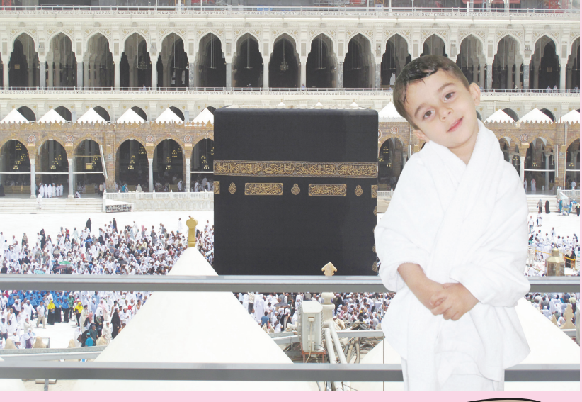
از نگاه دوربین