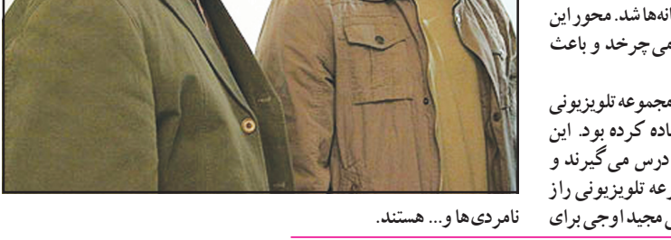
نامری ها و... هستند.