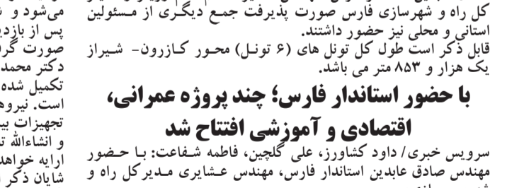
مدیرکل آموزش و پرورش، معاون آب روستایی، مدیرکل آب روستایی، مدیرکل آب روستایی، استاندار، مدیرکل فرهنگ و ارشاد اسلامی فارس، دکتر محمدصادقی

سرویس خبری / داود کشاورز، علی گلچین، فاطمه شفاعت: با حضور مهندس صادق عابدین استاندار فارس، مهندس عشایری مدیرکل راه و شهرسازی،