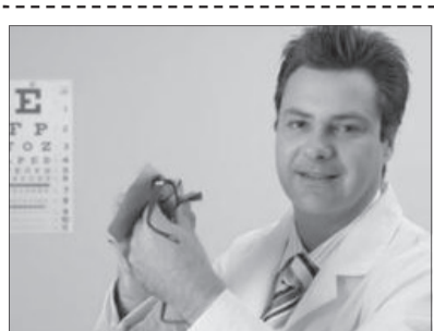
محافظ UV برای بخواهید.

۱- هرگز از دستمال کاغذی یا دستمال‌های توالت برای پاک کردن شیشه عینک خود استفاده نکنید. این دستمال‌ها از چوب ساخته شده‌اند و شیشه‌های عینک شما را خش می‌اندازند. دکتر Robert Noecher می‌گوید من از کراواتم برای این کار استفاده می‌کنم به این خاطر که از ابریشم ساخته شده و بسیار نرم و لطیف است. ۲- عینک‌های آفتابایی پولاریزه برای کم کردن حساسیت نسبت به نور و بازتاب آن از اجسام براق، بسیار مناسب هستند، اما برای دیدن صفحه‌های موبایل یا سیستم‌های راه‌باب شما را با مشکل مواجه خواهند کرد. این مشکل حتی برای دیدن صفحه‌های دستگاه‌های خودپرداز جدی تر خواهد بود. ۳- بسیاری از ما فکر می‌کنیم، پس از یک جراحی چشم، به سرعت می‌توانیم به زندگی عادی خود برگردیم، اما در واقع برای بسیاری از افراد، این زمان، مفادیری بیشتر طول می‌کشد. پس از اینکه مجبور شویم بر روی یک متن چند صفحه‌ای تمرکز کنیم، متوجه می‌شویم که آتقدار ما هم که فکر می‌کنیم کار ساده‌ای نیست و به زمانی بیش از این نیاز است. ۴- بسیاری از مردم می‌دانند که اشعه ماوراء بنفش (UV) به پوست آسیب جدی می‌رساند، اما نمی‌دانند که این اشعه برای چشمان نیز مضر است. آیا شما از کسانی هستید که تنها زمانی که آسمان آفتابی است عینک می‌زنید؟ عینک آفتابی را انتخاب کنید که اندازه کافی برای جلوگیری از ورود اشعه از بالا و پایین بزرگ باشند حتی اطراف آن نیز ضخیم باشد. اگر از لنز استفاده می‌کنید