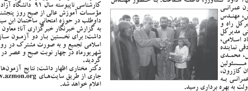
دولت الکترونیک در شهرستان کازرون به عنوان سومین شهر فارس پس از شیراز و نیریز افتتاح شد.

سرویس خبری / داود کشاورز، فاطمه شفاعت: با حضور مهندس اردکانی معاون عمرانی استانداری فارس، مهندس عشایری مدیرکل راه و شهرسازی، ممتی مدیرکل فرهنگ و ارشاد اسلامی، دکتر محمدصادقی نماینده مردم در مجلس، محمدی فرمانسدار و مسئولین ادارات شهرستان کازرون، چند پروژه عمرانی به مناسبت هفته دولت به بهره برداری رسید.