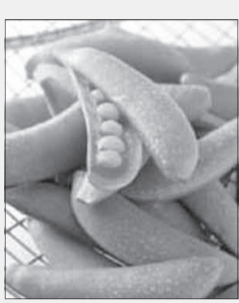
مناسب تری برای گوشت فرمز به حساب می‌آید.

آنها هم در زمانی که مدام صحبت از جنگ و تهدیدات نظامی در کار است. البته علی اکبر صالحی وزیر خارجه کشورمان، صحبت از برنامه‌های حاشیه اجلاس سران همچون بازدید از مراکز