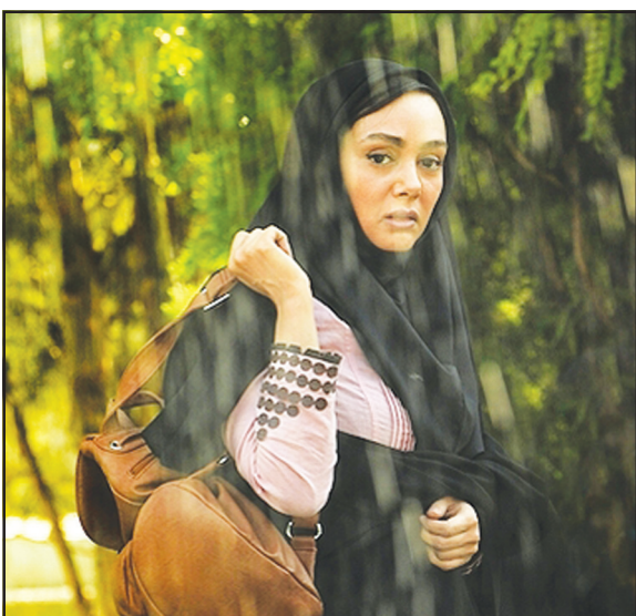
فیلمنامه نویسنده و مدیر داخلی دفتر فیلمسازی تیبان است و با فیلم سینمایی «زبان مادری» در سی امین جشنواره فیلم فجر حضور داشت.

وزیر آوار نمانند اما به هر حال «دل بی قرار» گسستن خانواده‌ای در آن زمان است. عوامل پشت دوربین این فیلم عبارتند از: نویسند: قربان محمد پور، مدیر فیلمبرداری: حسن پوریا صابری، دستیار اول کارگردان و مدیر برنامه ریزی: روح انگیز شمس، طراح چهره پردازی: عبدالله اسکندری، طراح صحنه: حسین فلاح، تدوین: حسین زندیاف، صدا گذار: محسن روشن، مدیر تولید: بهرام صابری، مدیر تدارکات: حسین لنجایی، عکاس: آرزو اتحاد و مشاور رسانه‌ای: سمانه احمدی.