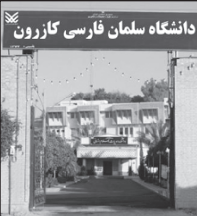
دانشگاه سلمان فارسی کازرون