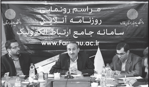
مراسم رونمایی روزنامه آنلاین سامانه جامع ارتباط الکترونیک

وی افزود: ما در نظر داریم رشته‌های مرتبط با رسانه‌ها را نیز در دوره تحصیلات تکمیلی را در دانشگاه پیام‌نور نیز اضافه کنیم.