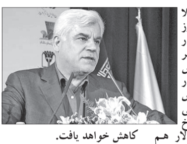
کاهش خواهد یافت.

یک سکه تمام یک میلیون و ۳۲۵ هزار تومان پرداخت کند. وی خاطرنشان کرد: با این نرخ، اگر این فرد بخواهد سکه خود را در بازار به فروش برساند ضرر خواهد کرد؛ بنابراین اعلام کردیم که این افراد در این مرحله نمی می توانند از تحویل سکه های خود انصراف دهند.