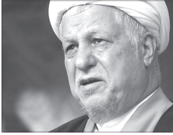
باید مسئولان مربوطه شرایط ایجاد حساسه سیاسی در کشور را

حضرت امام (ره) و خون شهدان است. به گزارش ایانا، آیت‌الله هاشمی رفسنجانی امروز در دیدارهای جداگانه با اعضای مجمع محققین و مدرسین حوزه علمیه قم و جمعی از روحانیون ستاد تبلیغاتی خود تأکید کرد: همه باید تلاش کنیم کشور را از گردنه های سخت مشکلات اقتصادی و معضلات به وجود آمده عبور دهیم.