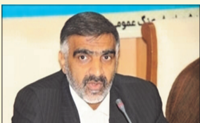
استاندار بوشهر تاکید کرد:

نصب تبلیغات روی خودرو مغایر با قانون است