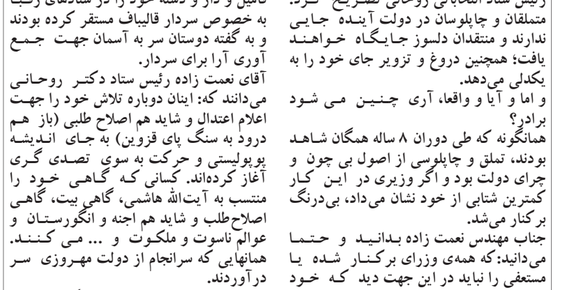
همانهایی که در انتخابات ریاست جمهوری با حمایت علنی و غیر علنی نیروهای هوادار، فامیل و دار و دسته خود را در ستادهای رقیبا به خصوص سردار قالیباف مستقر کرده بودند و به گفته دوستان سر به آسمان جهت جمع آوری آراء برای سردار.

آقای نعمت زاده رئیس ستاد دکتر روحانی می‌دانند که: اینان دوباره تلاش خود را جهت اعلام اعتدال و شاید هم اصلاح طلبی (باز هم درود به سنگ پای قزوین) به جای اندیشه پوپولیستی و حرکت به سوی تصدی‌گری آغاز کرده‌اند. کسانی که گاهی خود را منتسب به آیت‌الله هاشمی، گاهی بیت، گاهی اصلاح‌طلب و شاید هم اجنه و انگورستان و عوالم ناسوت و ملکوت و ... می‌کنند. همانهایی که سرانجام از دولت مهرورزی سر درآوردند. اینان امروز در تلاشند تا دلیل برکناری خود از دولت احمدی نژاد را انتساب به آقای هاشمی تبلیغ کنند؛ غافل از اینکه اگر کسی کمترین علاقه‌ای به ایشان داشتند، حتماً مناظره‌های سال ۸۸ و همه آقای هاشمی را به یاد می‌آوردند و هرگز با دولتی که استراتژی خود را بر مبنای تخریب آقای هاشمی و خانواده‌اش گذاشته بود، به جای زیر آب زدن این و آن برای رسیدن به پست، هرگز همکاری نمی‌کردند. جناب مهندس نعمت زاده: کافی است گردن‌ها و کمرهای خم شده اینان در برابر رئیس دولت‌های نهم و دهم را یک بار از روی تصاویر در همین اینترنت جستجو کنید. کاری چندش آور که به غیر از اینها از کس دیگری ساخته نیست. و سرانجام پرسش ما این است: اما و آیا و واقعا با آنان که ... چه می‌کنید؟