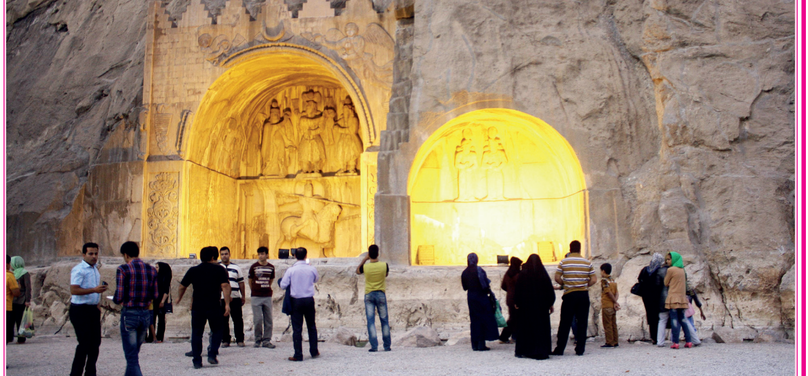
طاق بستان در کرمانشاه از نگاه دوربین

آقا محمدیان تاکید کرد: تجلیل از این هنرمند سینما و تلویزیون در مراسم اختتامیه هشتمین جشنواره فیلمنامه نویسی رضوی انجام خواهد شد.