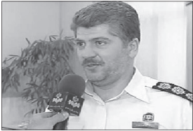
رئیس پلیس فتای تهران بزرگ از سرقت اینترنتی به ارزش ۲۷۰ میلیون تومان از حساب مشتریانی که با اینترنت امور بانکی خود را انجام می‌دهند، خبر داد.

رئیس پلیس فتا فرماندهی انتظامی فارس از دستگیری دختری ۱۶ ساله که اقدام به برداشت غیرمجاز از حساب مادرش کرده بود خبر داد. سرهنگ حسینی در تشریح این خبر گفت: زنی ساکن شیراز با مراجعه به پلیس فتا از برداشت غیرمجازی که از حسابش صورت گرفته بود شکایت داشت، وی ادامه داد: این شهروند که کارمند یکی از ادارات دولتی در استان فارس است اظهار داشت مدتی است متوجه کاهش موجودی حسابش شده و پس از مراجعه به بانک متوجه شده شخصی از حسابش اقدام به خرید اینترنتی کرده که وی از نحوه و چگونگی دسترسی به حسابش بی اطلاع می‌باشد. با اقدامات فنی انجام شده توسط کارشناسان این قالب مشخص شد برداشت‌های انجام شده از حساب شایکه همگی در قالب خرید اینترنتی کارت شارژ صورت گرفته است. سرهنگ حسینی گفت: با استعلام از بانک‌های مرتبط با این حساب و بررسی خطوط مورد استفاده برای خرید کارت شارژ و خطوطی که شارژهای خریداری شده بر روی آنها فعال شده بود متهم اصلی شناسایی و به این پلیس احضار شد. وی اظهار داشت: فرد متهم در این پرونده دختر ۱۶ ساله شایکه است و زمانی که مادرش از این موضوع اطلاع پیدا می‌کند با تعجب بیان می‌داند که «دخترم سارق حسابم است؟» رئیس پلیس فتا فرماندهی انتظامی استان فارس هشدار داد: این جمله برای بار اول نیست که در رابطه با این گونه پرونده‌ها شنیده می‌شود و متهم پرونده‌های برداشت غیرمجاز در بیشتر موارد به یکی از نزدیکان شاکی ختم می‌شود که این لزوم دقت خانواده‌ها در نگهداری اطلاعات بانکی خود را روشن می‌نماید.