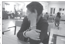
درسی اغفال و گردنبندش را سرقت کرده بود، شناسایی و دستگیر شد. به گزارش جام جم آنلاین به نقل از پایگاه اطلاع رسانی پلیس، سرهنگ حسین بیدمشکی