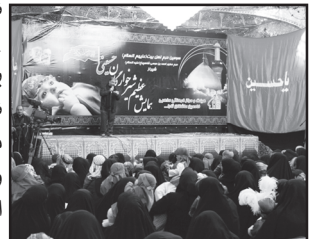
شیرخوارگان حسینی در آستان مقدس احمدی و محمدی (ع) معاینه شدند.

مشترک دانشگاه علوم پزشکی و خدمات بهداشتی درمان استان فارس و آستان مقدس صورت گرفت. وی اضافه کرد: این پزشکان متخصص از آغاز مراسم حاضر بوده و در موارد لازم به معاینه شیر خوارگان پرداختند. نامزد دکتر است گردهمایی بزرگ شیر خوارگان حسینی از ساعت ۸ صبح روز جمعه هفدهم آبان ماه ۱۳۹۲ مصادف با چهارم محرم به مناسبت سالروز شهادت حضرت علی اصغر (ع) در آستان مقدس برگزار شد.