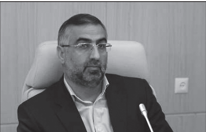
فرماندار شیراز در جلسه شورای بهداشت شهرستان شیراز.

مشکلات بهداشتی ناشی از وجود دامداریهای غیر مجاز در نقاط مسکونی و حاشیه شهر، کشتار غیر مجاز دام و وضعیت اتلاف سگهای ولگرد از دیگر موضوعاتی بود که رییس شورای بهداشت شهرستان شیراز از آنها به عنوان بخش دیگری از مشکلات شهرستان