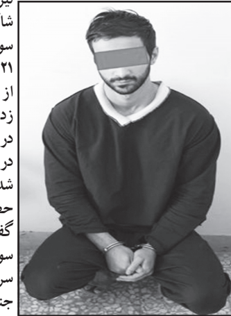
شاکی در حوالی نارمک مشغول کار بوده و آشنایی او با شاکی نیز در همان بنگاه به وجود آمده است.

با تشکیل پرونده مقدماتی با موضوع آدم ربایی و شروع به قتل، پرونده برای تحقیقات تکمیلی در اختیار اداره یازدهم پلیس آگاهی تهران قرار گرفت. با آغاز رسیدگی به پرونده کار آگاهان با مراجعه به بیمارستان به تحقیق از دختر جوان پرداختند که او در اظهاراتش گفت: برای خرید از خانه خارج شده بودم که ناگهان خواستگار سابقم سد راهم شد و با تهدید چاقو مرا سوار یک دستگاه خودروی پراید نقره ای کرد. او سپس مرا به خانه ای در حوالی میدان نبوت برد و با بستن دست و پالم مرا به آتش کشید. پس از دفاعی سوختن در میان آتش و در حالی که خواستگار سابقم در این مدت به التماس های من می خندید مرا به بیمارستان رساند و از آنجا متواری شد من هم تلفنی موضوع را به خانواده ام اطلاع دادم.