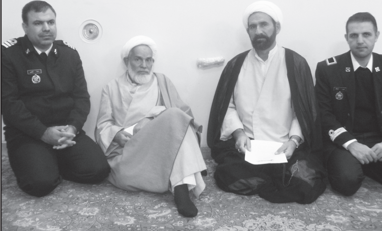
سروس خبری / نصرالله پناهی: به مناسبت بزرگداشت روز نیروی دریایی ارتش دو چرخه سواران نیروی دریایی ارتش استان کرمان با امام جمعه وقت شیراز دیدار کردند.

شمال خلیج فارس صورت گرفت در این عملیات پیروز مندان و غرور آفرین ۲۱ روز هم ادامه داشت و در منطقه ای بی وسعت ۴۰ کیلومتر مربع و به عرض ۵۰ کیلومتر مربع با مساحت ۲۰ هزار کیلومتر عملیات در بالان نیروی دریایی ارتش اسکله های البکر و الامیه و البکر توسط دریادلان نیروی دریایی ارتش صدور نفت کشور عراق تا پایان قطننامه ۹۸ از این دو اسکله منهدم شده امکان پذیر نشد و نیروی دریایی عراق در این منطقه کاملاً فتح شده بود.