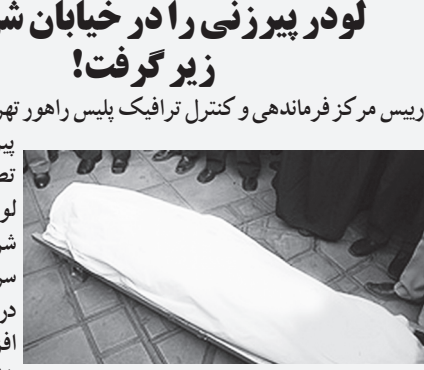
دستگاه لودر متعلق به کارگاه مترو در محدوده خیابان شریعی، خیابان معلم در حین دنده عقب رفتن با پیرزن ۸۲ ساله ای که در آن محل در حال تردد بود برخورد کرد که در پی آن این پیرزن سمن دردم کشته شد.