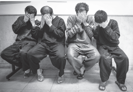
اینکه افرادی اقدام به تهدید با سلاح سرد و زورگیری از وی کرده اند، بررسی موضوع در دستور کار مأموران پلیس آگاهی شهرستان آستانه اشرفیه قرار گرفت.

گفت: تا سال آینده چه در زمینه قانون گذاری و چه سؤالات، شاهد حرکت سریع مجلس خواهیم بود و ۱۲ ساعت کار در مجلس و چهار ساعت کار کارشناسی برعکس خواهد شد.