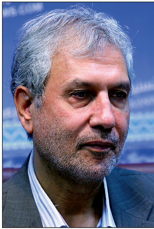
وزیر تعاون، کار و رفاه اجتماعی در پایان خطاب به رئیس سازمان تامین اجتماعی دستور داد بحث در مان در شهرستان فرجک پیگیری شود و کلینیک تخصصی برای درمان اهالی راه اندازی شود.