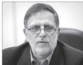
رئیس کل بانک مرکزی، تأمین سرمایه در گردش واحدهای تولیدی را اولویت نخست پرداخت تسهیلات بانکی اعلام کرد و گفت: با این رویکرد به تدریج ظرفیت های واحدهای تولیدی به طور کامل فعال و بخش تولید از رکود خارج می شود. ولی اله سیف در گفت و گو با

واحد مرکزی خبر افزود: تأمین منابع مالی برای تکمیل واحدهای نیمه تمام، اولویت دوم بانک مرکزی است و ظرفیت های جدید تولیدی ایجاد می شود و سرمایه گذاری ها با ثمر خواهد نشست. وی با بیان اینکه اموال نباید به سمت سرمایه گذاری جدید برویم، تصریح کرد: با اقباض پولی باید با شتاب بیشتری به سمت رشد و توسعه اقتصادی حرکت کنیم. او با اشاره به شرایط رکود تورمی در کشور بر ضرورت رعایت انضباط پولی تأکید کرد و گفت: انضباط پولی مؤثرترین راه برای کنترل حجم تولیدی و کاهش تورم است و با