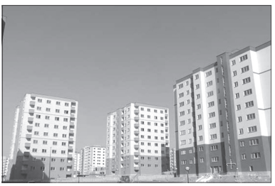
مسکن مهر نیز متفاوت است. وی با اشاره به اینکه در حال حاضر قیمت ساخت مسکن مهر هر متر ۳۳۰ هزار تومان است تأکید کرد: در این پیشنهاد که بصورت

رهر ادامه داد: به عنوان مثال برخی از پروژه های مسکن مهر پردیس که به تا زکی شروع شده و حدود ۱۰ درصد پیشرفت داشته بیشتر رشد قیمت خواهد داشت و برخی از پروژه ها که ۷۰ درصد رشد داشته اند، کمتر افزایش قیمت را تجربه خواهند کرد. رئیس کانون سراسری انبوه سازان گفت: با این روش قطعا سرعت ساخت و ساز مسکن مهر بیشتر می شود.