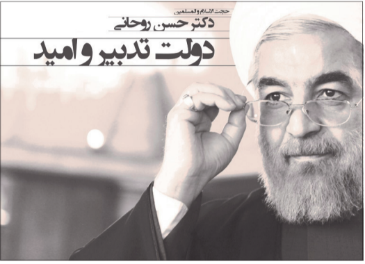
دکتر حسن روحانی دولت تدبیر و امید

برای تحقق و توجه به خواست و تقاضای مردم، سنگ اندازی هایی صورت گرفته و می گیرد. متأسفانه هنوز برخی از مسئولین در برخی شهرستانها و بخشها حاضر به قبول واقعیتها نیستند. اگر دکتر حسن روحانی با شعار تشکیل دولت تدبیر و امید و اعتدال توانسته است نظرات و رأی مردم را به خود جلب کند و اختصاص دهد، این بدان معناست که در قبال قولها و وعدههایی که