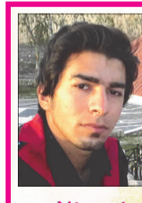
طرح از: امین غلام‌وازی