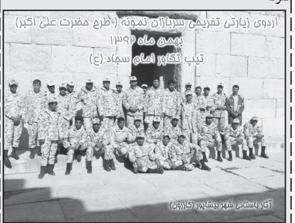
اردوی (زیارتی تفریحی سربازان نمونه) (طرح حضرت علی اکبر) بهمن ماه ۱۳۹۲ تیپ تکاور امام سجاد(ع)

فرماندهی و نمایندگی ولی فقیه در تیپ تکاور امام سجاد(ع) در راستای طرح حضرت علی اکبر (ع) و تشویق سربازان موفق و تلاشگر در عرصه انضباط معنوی و کاری، اقدام به برگزاری اردوی زیارتی تفریحی ورزشی نمود.