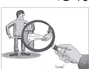
در این شاخص کشورهای گرجستان، ژاپن و سوئیس بالاترین تولید ناخالص ملی از نرخ تورم بیشتر باشد رفاه جامعه افزایش پیدا کرده است.

رشد تولید ناخالص ملی و سطح رفاه جامعه ارتباط تنگاتنگی وجود دارد. هر گاه نرخ رشد تولید ناخالص ملی از نرخ تورم بیشتر باشد رفاه جامعه افزایش پیدا کرده است.