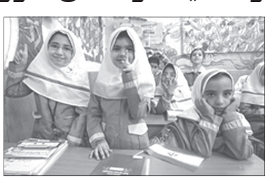
اقدا و علاوه بر اثرات اصلاحی و تربیتی در

رفتار و کردار مجرمین، تقدیر و تشکر فرهنگیان و مسئولان آموزش و پرورش استان را از اقدام اصلاحی این قاضی فهمید و فریخته به دنبال داشت.