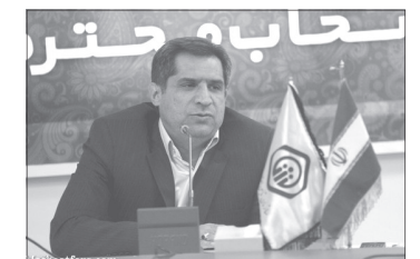
وی ادامه داد: در مجموع در کل استان فارس ۶۷۰ هزار بیمه شده وجود دارد.