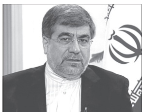
شد درآمد بیشتری کسب کند و به فرهنگ هم بخش بیشتری را اختصاص بدهد.

همین الان مجلس خودش به بودجه ای که دولت به مجلس داده بخشنی را اضافه کرده است. من نمی دانم که آیا درآمد به این صورت در سال آینده حاصل می شود یا خیر.