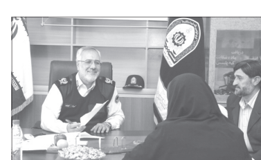
نظارت همگانی فرماندهی انتظامی استان فارس از نزدیک با سردار سجادیان دیدار و خواسته ها و پیشنهادها خود را در خصوص موضوع انتظامی استان مطرح و دستورات لازم توسط فرمانده انتظامی فارس برای مرتفع کردن خواسته های آنان صادر شد.

فرمانده انتظامی فارس با حضور در دفتر نظارت همگانی (۱۹۷) از نزدیک با ۱۹۴ نفر از شهروندان دیدار کرد.