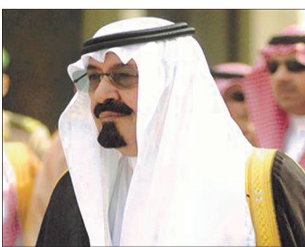
امیر سعودی عربستان

برخی منابع خبری اعلام کردند که ولیعهد عربستان سعودی جزایر مالدیو را برای گذراندن تعطیلات چند روزه خود به طور کامل اجاره کرده است. به گزارش ایسنا جمهوری اسلامی به نقل از گزارش سی.ان.ان نوشت: بسیاری از گردشگران که در حال برنامه‌ریزی برای سفر روایی خود به مالدیو بودند در پی اقدام این امیر سعودی با دربهای بسته روپرو شدند. برخی گزارش‌ها حاکی است که سلمان بن عبد العزیز آل‌سعود ولیعهد عربستان سعودی با پرداخت مبلغ ۳۰ میلیون دلار سه جزیره مالدیو را از ۳۰ بهمن الی ۶ اسفند «به صورت درستی» اجاره کرده است. همچنین برخی منابع خبری اعلام کردند که سلمان بن عبد العزیز آل‌سعود یک بیمارستان صحرایی، یک قایق تفریحی بسیار مجلل و بیش از ۱۰۰ نگهبان شخصی را هنگام ورود به مالدیو، همراه خود برده است.