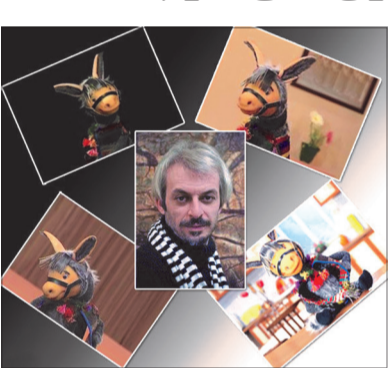
مجموعه کلاه قرمزی

این روزها که مجموعه «کلاه قرمزی» بین آمدن و نیامدن بلا تکلیف مانده است، صدایشه «جیگر» - یکی از پرطرفدارترین شخصیت های «کلاه قرمزی» - درباره‌ی ادامه‌ی ساخت این مجموعه می‌گوید: من هم مثل همه بی‌خبرم و تنها از طریق خبرهای خود شما جوای حال «کلاه قرمزی» می‌شوم. کاظم سیاحی درباره ادامه یافتن تولید و پخش «کلاه قرمزی» در تلویزیون به خبرنگار سرویس تلویزیون و رادیو خبرگزاری دانشجویان ایران (ایسنا) گفت: علاقه‌ی شخصی‌ام این است که دوست دارم «کلاه قرمزی» امسال هم مثل هر سال باشد و شخصیت «جیگر» هم در کنارش حضور داشته باشد، اما تاکنون هیچ صحبتی با ما