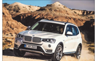
بی.ام.و مدل ۲۰۱۴

همیشه خودروهای شرکت بی ام و به خاطر ظاهر جذاب مورد تحسین واقع شده‌اند اما از طرفی کیفیت و طراحی داخلی خودرو بسیار ساده و معمولی یکی از موارد انتقادی از این خودرو بوده است. به گزارش ایسنا، اقتصاد آنلاین نوشت: این مدل خودرویی تماماً لوکس که اینبار علاوه بر ظاهر جذاب از تمامی المانهای لاکچری در داخل خودرو نیز بهره برده و تحسین همگان را در این زمینه نیز بدست آورده است. این بار نوبت به X3 رسید تا با ایجاد تغییرات در کیفیت و طراحی داخلی و چراغ‌های جذاب در جلوی خودرو تحسین همگان را برانگیزد. قیمت این خودرو در حدود ۳۰۰۰۰ پوند تعیین شده است.