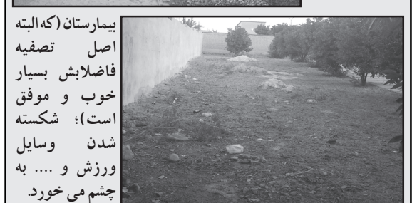
بیمارستان (که البته اصل تصفیه فاضلاب بسیار خوب و موفق است)؛ شکسته شدن وسایل ورزش و ... به چشم می خورد.

پارک سلمان در نگاه اول، دو چهره‌ی متفاوت دارد: چهره‌ی اول: کارگران به مساحتی وسیع مشغول زیرساخت، خیابان بندی، پله گذاری، احداث میادین و ... هستند و از این بابت باید به شهردار و همکارانش، اعضای شورای شهر و نیروهای خسته‌نماشید. گفت: اما چهره‌ی دوم: بافت ساخته شده‌ی قبلی با درختان، فضای سبز و وسایل ورزش صبحگاهی است. متأسفانه در این قسمت، بیشتر از هر چیز آشغال‌ها، نخاله‌ها، کچلی محیط و فضای سبز، عدم هرس درختان، بوی بد فاضلاب