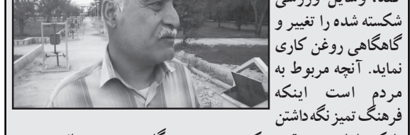
در این شهر دانشجویان غیر بومی، مسئولان غیر بومی و میهمانان داخلی و خارجی در رفت و آمد هستند و شهرداری و مردم باید هر کدام وظیفه خود را به خوبی انجام بدهند.

بازدید می‌هم از تصفیه‌خانه فاضلاب بیمارستان داشتیم انصافاً کار تصفیه‌خانه آن‌ها عالی است و همگی باید از آن حمایت کنند و لی به خاطر بوی بد آن گفتیم که با کارشناسان تهران صحبت کنند و با تلفن آن‌ها را بدهند تا از طریق روزنامه طلوع با آن‌ها تماس حاصل شود و فکری برای حذف بوی بد فاضلاب آن شود. طی ماه آینده مواردی که بیان شد مورد بازدید خبرنگار ما قرار گیرد تا گزارش رفع عیوب و نواقص به مردم داده شود و از زحمات مسئولان و رعایت نکات فوق توسط شهروندان تقدیر شود.