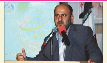
مدیر کل امداد فارس:

ایشان با اشاره به این که جبهه استکبار غیر از دو عامل مادی تهدید نظامی و تحریم هیچ در اختیار ندارد، تصریح کردند: دشمن در زمینه تحریم و تهدید نظامی دستش خالی است و کارش این است که دستگاه محاسباتی ما را خراب کند.