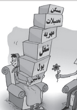
مشکل من مشکل شماست

دولت می تواند صندوقی را تحت عنوان حمایت از جوانان جویای کار و یا بیکار تأسیس کند و بودجه آن هم از طریق کم کردن حقوق های نجومی برخی از اشخاص خرد و حتی خود آن اشخاص هم می توانند زندگی خوبی داشته باشند و نیازی به حقوق های نجومی ندارند و از طریق کم کردن این حقوق ها و واریز آن به صندوق مذکور می توان ردیفی برای اشتغال چنین جوانان تأسیس کرد.