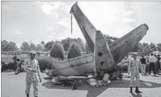
خود بیابند و ببینند که منافعشان دارد به اجفاف در حق مردم تبدیل می شود.

خطر می اندازند؟ نمی دانم این دلواپسان میزبان نگرانی و دلواپسی شان به این جور مشکلات و معضلات پیش روی مردم قد نمی دهد یا با کتمان واقعیت ها نمی خواهند جلوی زد و بند و منفعت جویی ها گرفته شود؟ به هر حال چنین بی تفاوتی ها و خط و خطوط بازی های سیاسی، جز تحقیر و تهدید مردم، نمر و سودی ندارد. شاید وقتی صحبت از تحقیر می شود، عده های خوب بدانند به کار گیری هواپیمای اجاره ای از کشور عربستان سعودی و قطر، نمونه ای از آن باشد. در نظر بگردید شما مسافر یک هواپیمای غول پیکر خطوط هواپیمایی عربستان سعودی و قطر، نمونه ای از آن باشد. در نظر بگردید شما مسافر یک هواپیمای غول پیکر خطوط هواپیمایی عربستان سعودی و قطر، نمونه ای از آن باشد.