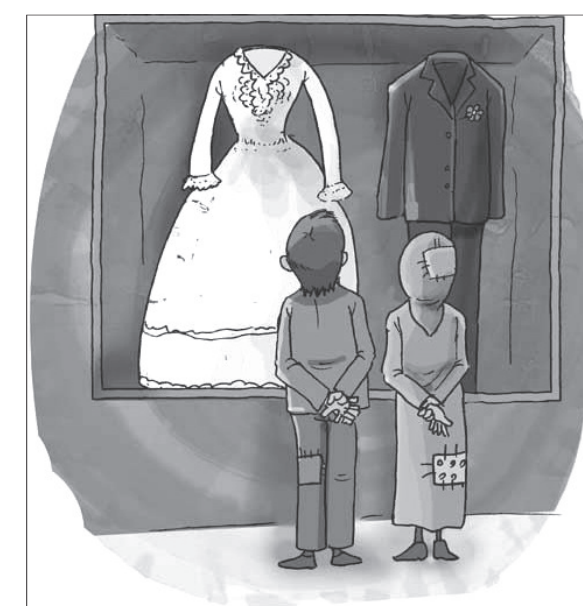
نشان می دهد که باید به این مقوله به عنوان بختی عمده، اصلی و کلان توجه گردد.

صورتی قابل طرح در مجلس است که در آن طریق جبران کاهش درآمد یا تأمین هزینه جدید نیز معلوم شده باشد. علی ایحال عدم ازدواج همانطور که بیان شد مانند دیگر آسیب ها و معضلات جامعه معلول عوامل مختلفی است که بیکاری مادر عوامل مذکور است. بررسی بانک مرکزی از نرخ بیکاری جوانان نشان می دهد که در سه ماه اول سال ۹۲ نرخ بیکاری در بین جوانان ۱۵ تا ۲۹ سال ۳۲/۲۰ درصد بوده که نرخ قابل تأملی است. مسلمانان در بین جوانان بیکار میل و رغبتی جهت ازدواج دیده نمی شود. در بعضی از آیات قرآن کریم از جمله آیه ۳۶ سوره یاسین و آیه ۲۱ سوره مبارکه روم به اهمیت و ضرورت موضوع ازدواج تأکید شده است. همچنین در قوانین کشور ما از جمله قانون اساسی که مهمترین سند قانونی کشور می باشد در چند اصل از جمله اصل ۱۰ به بر اساس آنجایی که خانواده بنیادی ترین واحد ساختاری جامعه اسلامی است همه قوانین و مقررات و برنامه ریزیهای مربوطه باید با هدف آسان کردن تشکیل خانواده، پاسداری از قداست آن و استواری روابط خانوادگی بر پایه