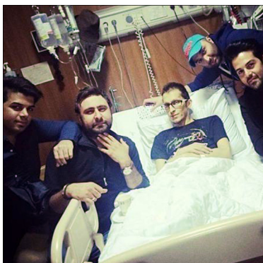
مهدی مقدم عماد طالب زاده و محمد علیزاده

بستری شدن یک خواننده پاپ که مدتهاست با بیماری دست و پنجه نرم می کند، باعث شد بزرگان پاپ بر بالینش حاضر شوند. مرتضی پاشایی به دلیل بروز برخی مشکلات جدید از اوایل هفته گذشته در یکی از بیمارستان های تهران بستری شده است تا تحت نظر تیم مجرب پزشکی اش قرار بگیرد.