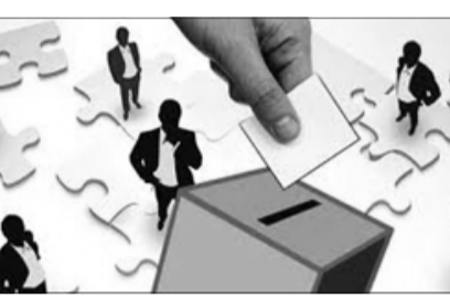
معاون سیاسی امنیتی و اجتماعی استاندار فارس گفت: در بعضی شهرها و روستاهای استان فارس برخی از کاندیدها اقدام به فعالیت های انتخاباتی زودهنگام می کنند که توسط استانداری رص می شوند.

برای اهداف سیاسی، شخصی و انتخاباتی استفاده می کنند برخورد قانونی می شود. وی با اشاره به اینکه حادثه هواره در کمین است و باید آماده مقابله با هرگونه حوادث طبیعی باشیم، افزود: باید از تجربه حوادث بیم که در روزهای ابتدای زلزله