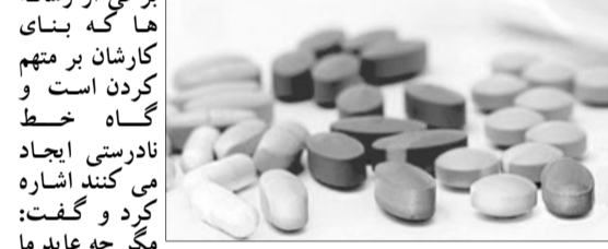
مردم کینیم. خود را مدیون می شود که با دروغ گویی، مردم کینیم.

بودن قرص کلدکس بود که هفته گذشته در فضای مجازی منتشر شد. دکتر سید امیر رضویان مدیر عامل شرکت داروسازی دکتر عبیدی در واکنش به شایعه ای که برخی رسانه ها در مورد توهم زا بودن قرص کلدکس منتشر کرده، به خبرنگار مهر گفت: این خبر به دلیل نامشخص بودن منبع که از طرف یکی از پزشکان اورژانس بیمارستانی در تهران مطرح شده است هیچ گونه اثری از انتشار پزشکان اورژانس بیمارستانی در تهران مطرح شده است هیچ گونه اثری از انتشار پزشکان اورژانس بیمارستانی در تهران مطرح شده است