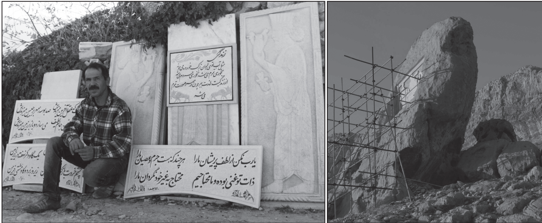
نقش قندیل، متعلق به دوره ساسانیان است و تنها نقشی است که در آن، زن پوشیده ای نمایان است؛ این زن، آذر آناهیتا، در کنار همسرش شاپور اول و یک موبد دیده می شود