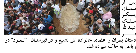
دستان پسران و اعضای خانواده اش تشییع و در قبرستان "العود" در ریاض به خاک سپرده شد.

پیش از خاکسپاری پادشاه فقید عربستان، در مسجد جامع ترکیه ریاض بر پیکر وی نماز خوانده شد. پس از آن مراسم تشییع و خاکسپاری در آنجا برگزار شد.