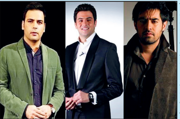
دو تن از مجریانی بودند که مردم در کارنامه ۲۰ ساله شبکه سه به عنوان بهترین ها انتخاب کرده بودند.