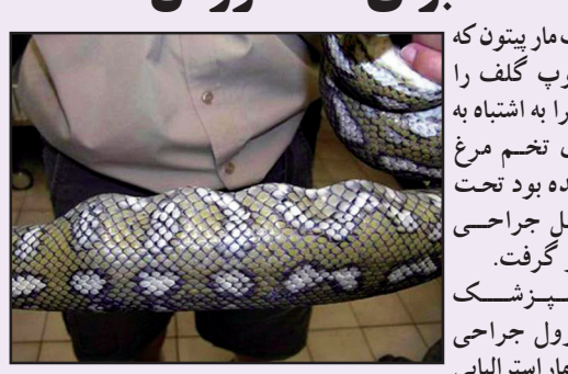
یک مار پیتون که ۴ توپ گلف را ظاهراً به اشتباه به جای تخم مرغ بلعیده بود تحت عمل جراحی قرار گرفت. دامپزشک مسوول جراحی این مار استرالیایی گفت که یک زن و شوهر توپ های گلف خود را در محل تخم گذاری مرغان قرار داده بودند.

این عمل صاحب خانه برای اینکه خروس ها را تشویق کند که به لانه بروند و همین امر مار پیتون را به اشتباه انداخته و باعث شده بود تا توپ های گلف را به جای تخم مرغ بلعند. و مار پیتون گرسنه پس از اینکه چند توپ گلف را بلعیده تازه فهمید آنها تخم مرغ نیستند. چند روز بعد که زن و شوهر استرالیایی به سراغ توپ های گلف خود می روند و متوجه می شوند که توپ ها در جای خود قرار ندارند با یک مار پیتون بسیار بزرگ مواجه می شوند و از آنجاییکه متوجه می شوند مار پیتون توپ ها را بلعیده است، آن را به یک مرکز حیات وحش انتقال می دهند تا دامپزشکان موجود در مرکز، توپ ها را از معده آن خارج کنند. به گزارش ایران ناز پزشکان استرالیایی مار پیتون سی و دو اینچی را مورد رادیولوژی قرار دادند و تصاویر رادیولوژی از شکم مار نشان داد که توپ های گلف گمشده در شکم مار قرار دارد. پزشکان با استفاده از عمل جراحی موفق شدند چهار عدد توپ گلف را از شکم مار بیرون آورند. پزشکان می گویند مار پیتون در حال بهبودی پس از عمل جراحی بسر می برد و تا چند هفته دیگر می تواند به حیات وحش بازگردد.