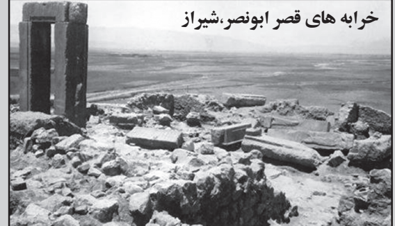
خرابه‌های قصر ابونصر، شیراز

نوروز نزدیک است و عاشقان شیراز به این شهر اهورایی مشرف می‌شوند. نام شیراز در آسمانه‌های ایران و پارس طین انداز می‌گردد و عاشقانه‌های شیخ و عارفانه‌های خواجه، همراه با چهچه بلبلان گلستان و بوستان‌های همیشه جاوید این شهر مقدس زم زمه گر می‌شوند. بوی بهار نارنج هر گردشگری را به وجد در می‌آورد. شیراز، بهشتی به جا مانده از تاریخ، خطه‌ای پاک و اهورایی که تاریخ به آن می‌بالد. شهری که هر گاه زبانی به شعر گشوده شود، وصفی از آن مورثانه‌وار شاعر را زیر و رو میکند. شکوه تاریخی این سرزمین دلبر پرور همواره باعث عبرت خواهد بود؛ در دیدبخت، مهر تاییدی بر داشته‌های فرهنگی، هنری، تاریخی، مذهبی و طبیعی این شهر دیرین می‌باشد. شهر شیراز برای همه جهانیان نامی آشناست. اما متأسفانه در باب قدمه و محل اصلی این شهر دلنواز کمتر تحقیق شده و در خصوص تمامی اماکن تاریخی، فرهنگی، طبیعی و مذهبی آن اطلاع‌رسانی وسیع، جامع و دقیقی تا به حال آنچنان که شایسته آن باشد صورت نگرفته است. در حالیکه معرفی، سرمایه‌گذاری و... در مورد برخی از آثار مهم ولی فراموش شده این شهر، می‌تواند گردشگران زیادی را از داخل و خارج کشور به این گلشن راز جذب نماید.